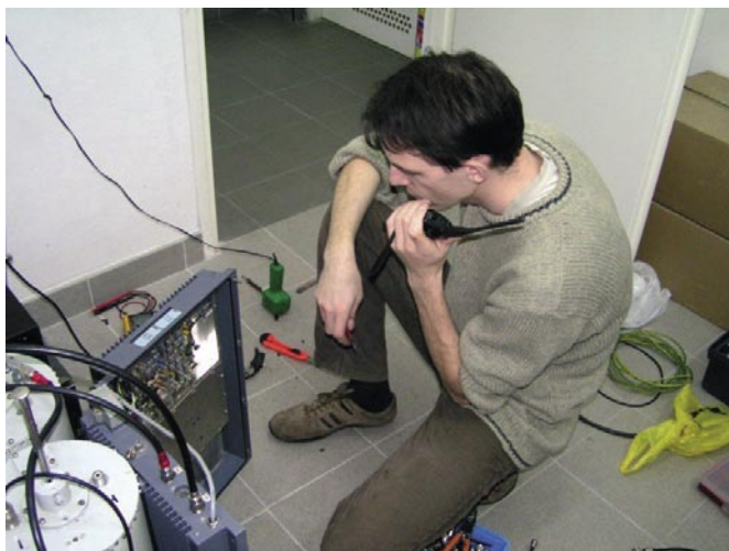
Przemienniki w Miłkach – nie wszystko od razu działało

Przemiennik SR4M – 145.600 MHz – to fabryczne urządzenie STORNO CQF 612. Nadaje z mocą 10W, ale do anteny dociera około 4W (100m przewodu!). Zainstalowano w nim mikroprocesorowy sterownik z komunikatami głosowymi oraz generatory i deko-