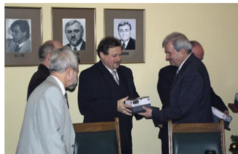
Prezydent Bydgoszczy wręcza nagrody najaktywniejszym krótkofalowcom