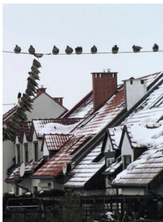
Jemiołuszki na antenie Darka SP6NVK