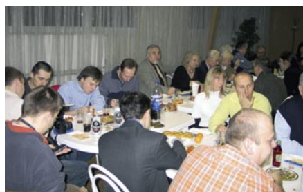
Przy wigilijnym stole w Praskim Oddziale Terenowym PZK