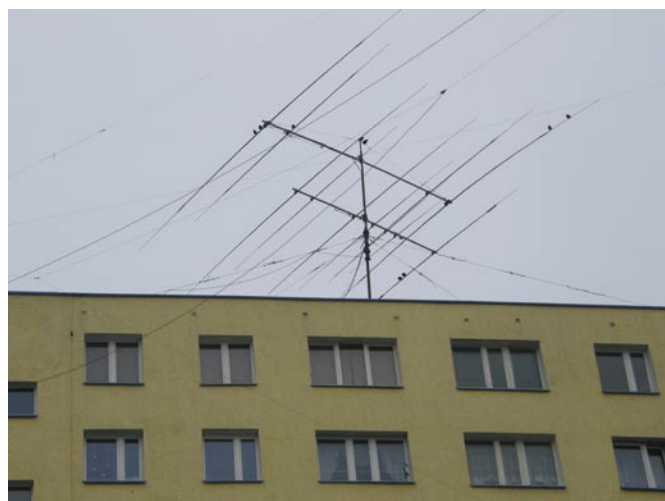
Piękne anteny SP1PEA

pieniem nowego prezesa i obietnicą zorganizowania pikniku dla krótkofalowców i ich rodzin. Zanim opuściliśmy gościnne progi OT 22, odwiedziliśmy prężnie działający Klub SP1PEA. Klub mieści się w jednym z budynków Spółdzielni Mieszkaniowej „Na Skarpie”. Klub kształci przyszłych adeptów krótkofa-