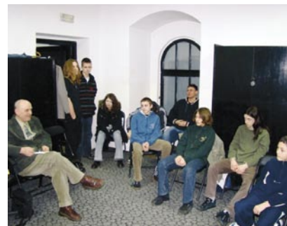
Roman SP4GDC opowiada młodzieży o swoich pierwszych łącznościach