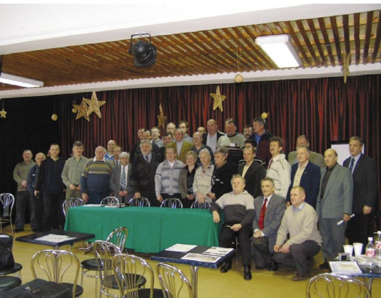
Członkowie OT 22