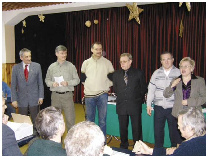
Nowy zarząd OT 22. Poniżej: w klubie SP1PEA