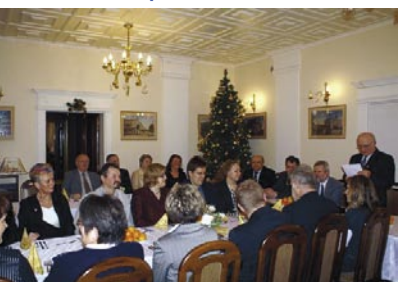
Spotkanie noworoczne jarosławskich krótkofalowców i zaproszonych gości