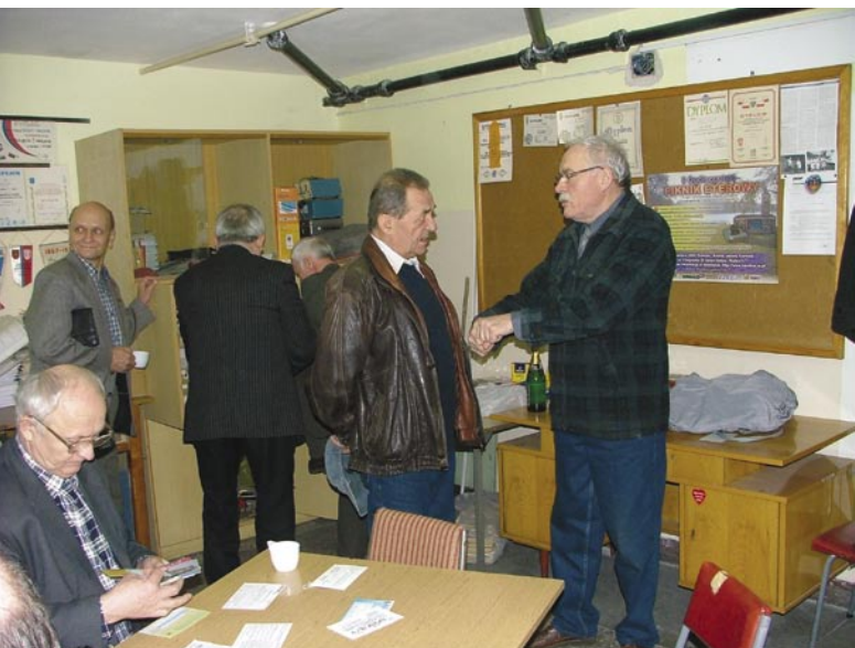
Przed walnym zebraniem