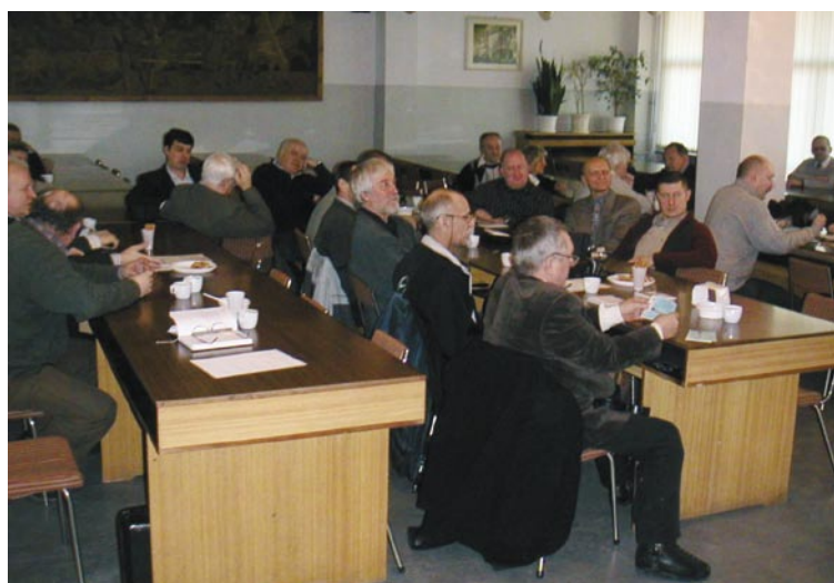
Fragment sali obrad