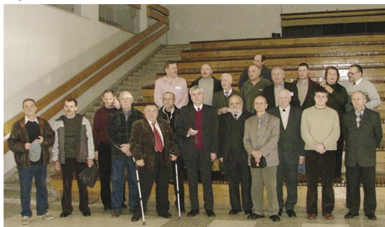
Część uczestników walnego zebrania