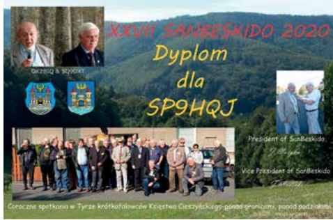
ODBYWAJĄCE SIĘ CO ROK W PAŹDZIERNIKU SAN BESKIDO, ORGANIZOWANE PRZEZ JANKA OKZBIQ I JANKA SQ9DXT, Z UWAGI NA WIRUS COVID 19 W 2020 ROKU NIE ODBYŁO SIĘ, ALE ODBYŁO SIĘ W TRYBIE ZDALNYM TZN. NA PASMACH RADIOWYCH I KAŻDY UCZESTNIK SPOTKANIE RADIOWEGO MIAŁ OKAZJĘ OTRZYMAĆ OKOLICZNOŚCIOWY DYPLOM

Podobny system łączności działa też w Centrum Kliniczno-Dydaktycznym w Łodzi.